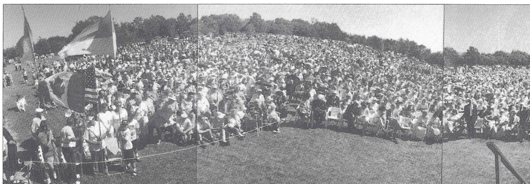
Canadian-Ukrainians celebrate Ukraine's 5th Anniversary of Independence, Aug. 1996. Канадські українці святкують 5-ту річницю Незалежності України, серпень 1996 р.

All photos reprinted from previous issues of the MONITOR