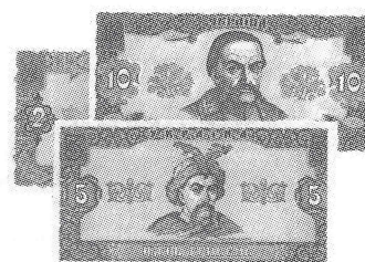
New Ukrainian currency - printed in Canada. Нові українські гроші - надруковані в Канаді.